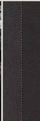
Sièges Sport Dinamica noir CE + WL3 1