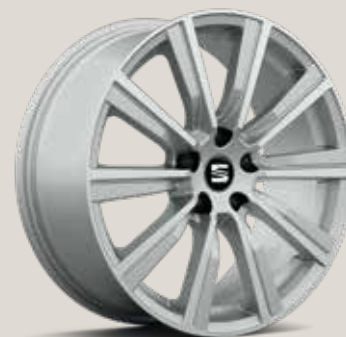
CupRacer Grey St FR