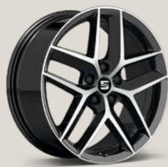
Performance 30/2 Usinée FR