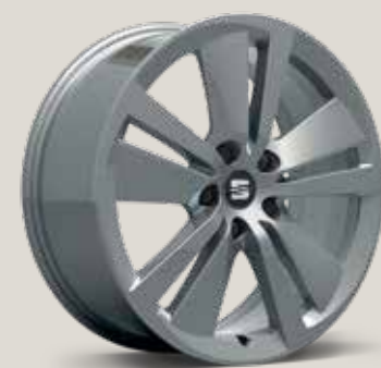
Anthracite St FR