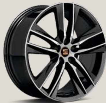
CUPRA 30/2 Noir brillant EU

Move Ultimate ST FR Limited Edition FR CUPRA EU De série ■ En option ■