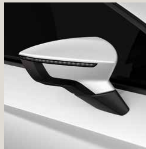
White 1 St

Move Ultimate St FR Limited Edition FR CUPRA CU De série ■ En option ■